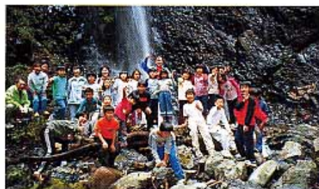
白糸の滝を背に記念写真

源流は素晴らしいところでした。水の中に入り自分で歩くアドベンチャープランは、他ではなかなか体験できないので大変良かった。貴重な体験が出来るこのコースに拍手を送りたい。どんどん下流の子供を呼びたいですね。