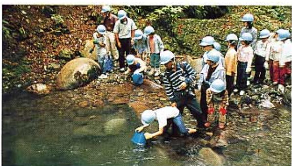
清流の生き物を探る