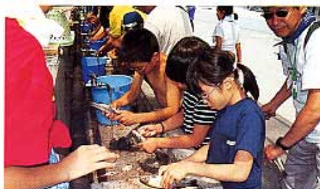
挿れた魚のワタだしに挑戦