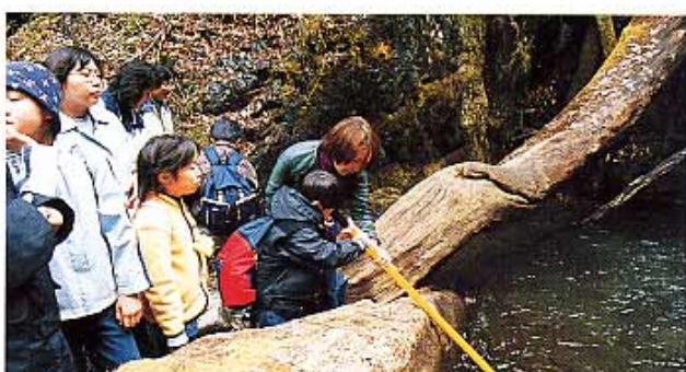
清流の生き物を探る