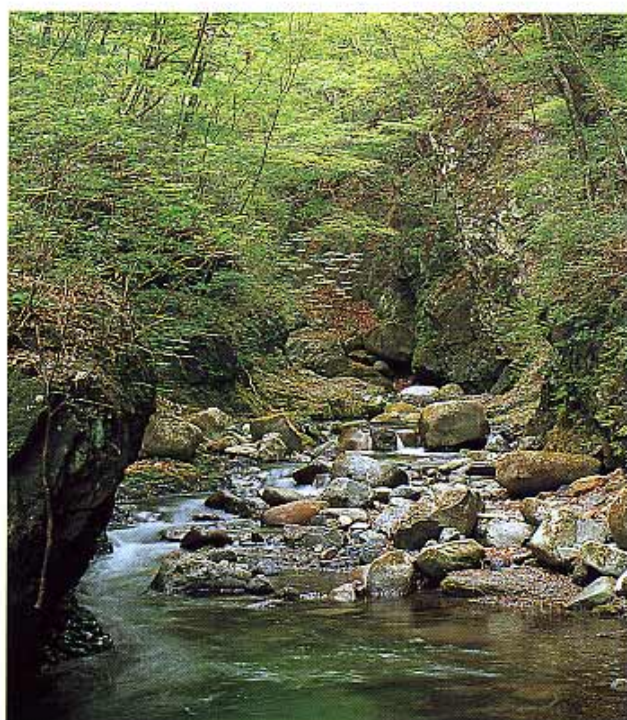
小菅川の清らかな流れの中を体験する