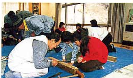
竹鉄線づくり体験