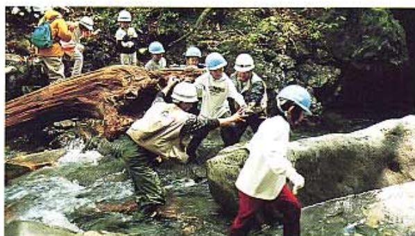
自分の力で谷を渡る