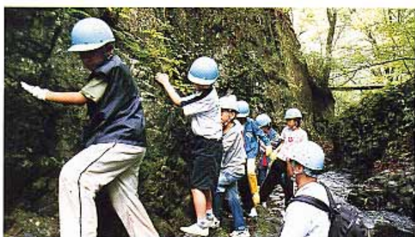
自分の判断で前に進む